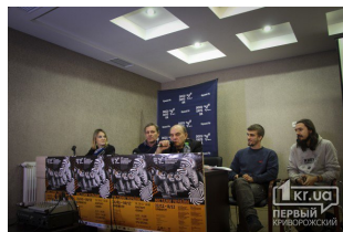
Міжнародний фестиваль «Docudays UA» у Кривому Розі 1kr.ua