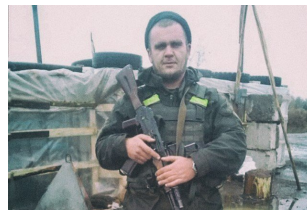
В Кривом Роге побили бойця АТО. Коментарий поліції 1kr.ua