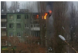
Настоящая причина взрыва дома на Днепропетровщине

Взрыв в Кривом Роге. Эпицентром стала квартира в многоэтажке. От ударной волны почти во всем доме вылетели окна и двери. Все произошло днем, когда большинство жителей были дома. Есть ли пострадавшие и что взорвалось — смотрите в сюжете телепрограммы «Детали».