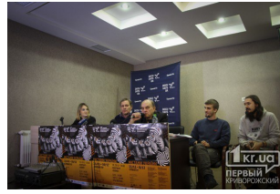
Міжнародний фестиваль «Docudays UA» у Кривому Розі

2016-11-21 19:30 Кирило КРИЗАЛІС dniprograd.org