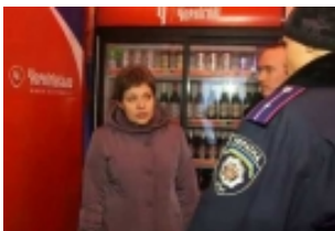
Мандрівний фестиваль "Docudays UA" - у Кривому Розі rudana.com.ua

Загалом, фестиваль відкритий кожному. Безкоштовний, аполітичний і злободенний.