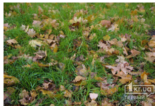
Погода в Кривом Роге на 22 ноября 1kr.ua