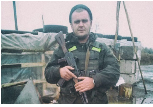
В Кривому Роге побили бойця АТО. Коментарий поліції

«Після того, як наша поліція дві години їде на виклик, у мене і зовсім пропадає бажання звертатися до них за будь-якою допомогою», - підсумував борець АТО.